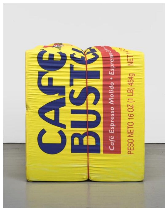
Lucia Hierro (n. 1987, New York, NY), 10oz. Café Bustelo , 2022. Espuma, impresión digital sobre satén de algodón, elástico, 53 x 43 x 25 plgs.

X Factor está comisariada por Christian Viveros-Fauné, curador general del CAM, y organizada por el Museo de Arte contemporáneo de USF. X Factor cuenta con el apoyo del National Endowment for the Arts.